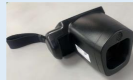
◀スポットビジョンスクリーナー

身体計測やスポットビジョンスクリーナーという機器を使って視力障害のリスクを確認します。